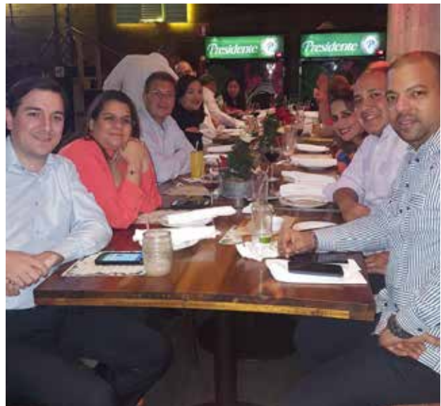
Compartir Navideño 2018