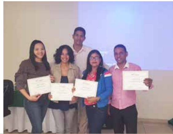
Taller Servicio al Cliente